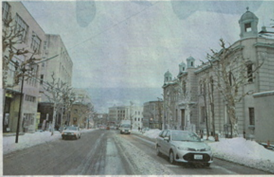
旧日銀小樽支店(右)など往時の繁栄を伝える「色内銀行街」。小樽市単独での日本遺産認定の構成文化財候補の一つだ