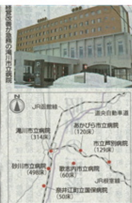
滝川市立病院の位置が人口減少により、地域医療維持が難しくなっている。人口減少により、地域医療維持が難しくなっている。

【滝川】滝川市立病院の人口減少により、地域医療維持が難しくなっている。人口減少により、地域医療維持が難しくなっている。