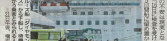
クルーズ船下船後の感染判明