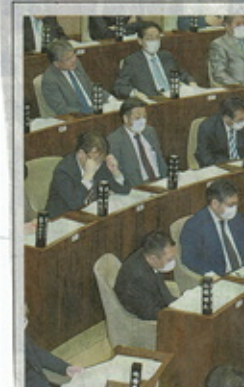
マスク 舌刺す場でも

新型コロナウイルスの感染拡大を抑制するため、首相は21日、全国の小中学校、高等学校、特別支援学校に臨時休校を要請した。