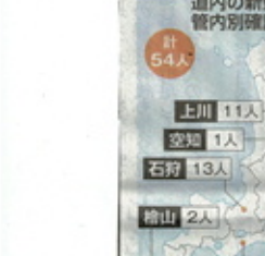
道内の新型コロナウイルス感染者の管内別確認状況

道議、理事者ともほぼ全員マスクをつけて臨んだ道議会の本会議場。新型コロナウイルスの感染拡大を防止するため、議会議場が前日、出席者に着用を要請した。