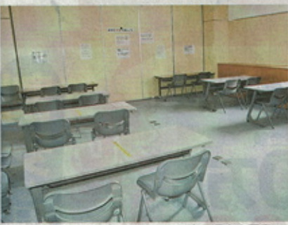
外出自粛要請に伴い閉鎖された岩見沢市立図書館の自習室=1日

4日の公立高入試を前に、新型コロナウイルス感染症拡大防止のため、市内の自習室や塾が休業する動きが出ている。会場下見取りも中止された。