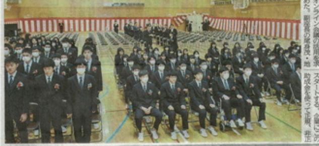
新型コロナウイルス感染症の拡大に伴い、道内老年層への感染拡大が懸念されている。...