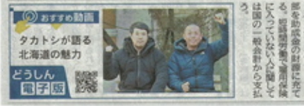
タカトシが語る北海道の魅力