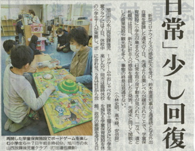
再開した学童保育施設でボードゲームを楽しむ小学生ら。