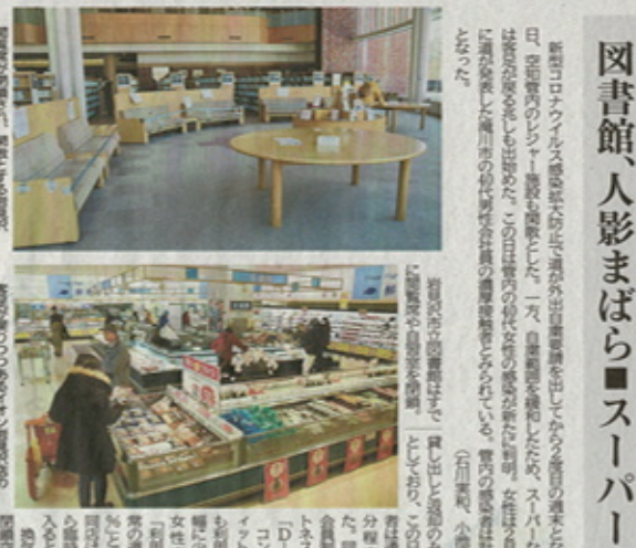
新型コロナウイルスの感染拡大を受け、2度目の週末、商店街は閑散とした様子。