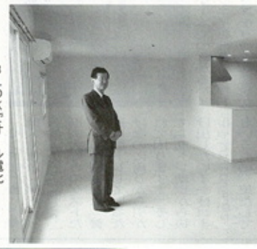
規模は鉄筋コンクリート造7階建て