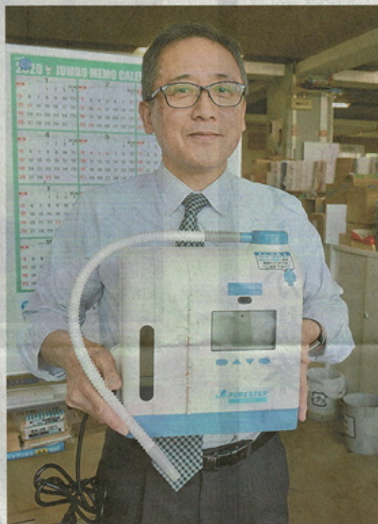
⑤高い殺菌力がある微酸性電解水を生成する装置。公共施設の消毒に活用する ④市内での感染症対策を話し合った対策本部会議＝9日午前9時半