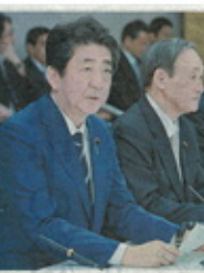
緊急対策第2弾をまとめた新型コロナウィルス感染症対策本部会合に出席する安倍首相（左）と菅首相（右）。