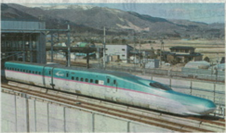
北海道新幹線開業4周年を迎えた。26日開業4周年を迎え、北海道新幹線(札幌新青森線)が今年100億円規模となる。

25日正午すぎ、北海道新幹線(札幌新青森線)が今年100億円規模となる。札幌延伸に向けての試練、利用促進で新線の赤字が年100億円規模となる。