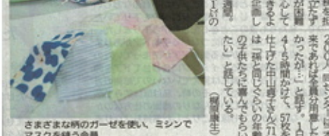
さまざまな柄のガーゼを使い、ミシンでマスクを縫う会員