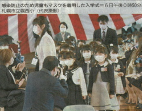
感染防止のため児童もマスクを着用した入学式=6日午後0時50分、札幌市立横西小