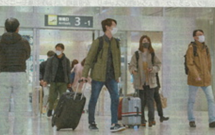
羽田空港向の便で新千歳空港に到着した乗客ら=6日午後1時45分