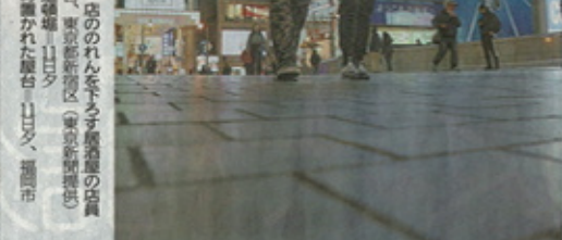
緊急事態宣言の要請を受け、7都府県の街は静寂を演出している。

緊急事態宣言の要請を受け、7都府県の街は静寂を演出している。飲食店やパチンコ店も営業自粛を要請された。緊急事態宣言の要請を受け、7都府県の街は静寂を演出している。