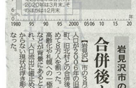
岩見沢市の人口の推移。2006年は合併時、2020年は3月末、そのほかは12月末。

岩見沢市の人口が2006年の旧岩見沢市、旧北村との合併後、初めて8万人を割った。少子高齢化や札幌への一極集中などが背景にあるとみられ、人口流出に歯止めがかからない現状が浮き彫りとなった。