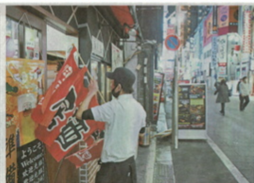
ススキノの繁華街。緊急事態宣言の要請を受け、飲食店やパチンコ店も営業自粛を要請された。

安部首相が1日に表明した都道府県への緊急事態宣言の要請に、札幌市は「ススキノ」の飲食店関係者は大苦戦を余儀なくされた。ススキノは、ススキノの飲食店関係者は大苦戦を余儀なくされた。ススキノは、ススキノの飲食店関係者は大苦戦を余儀なくされた。