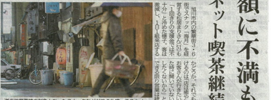
道の休業要請の対象となったスナックなどが並ぶ札幌・ススキノ。休業が営業継続か対症は割れそうだー20日午後6時35分、札幌市中央区南5区4

新型コロナウイルスの感染拡大を防ぐため、全道に拡大された緊急事態宣言を受け、鈴木直道知事が20日、全道的な休業要請を表明した。代わりに示した支援金は10万円、30日間の休業要請の対象施設がパチンコや「安心して休めぬ」などの施設に拡大された。店主は「支援額が少なすぎる」と不満を口にしている。客に配慮し、ネット喫茶を継続している。