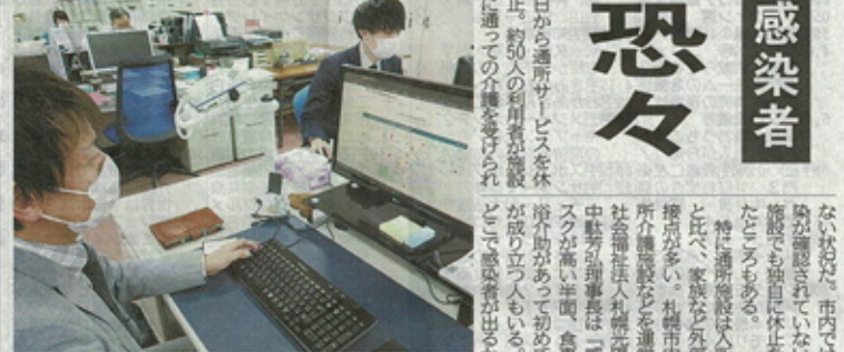
千歳市内の介護施設の開設状況などについて情報を収集する市在宅医療・介護連携支援センターの職員