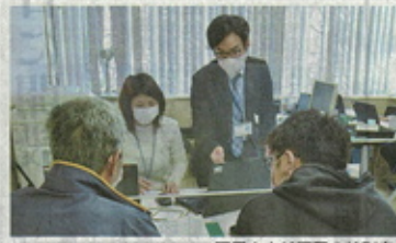
早く手元へ 国民1人10万円の特別定額給付金について、上川管内東川町は28日、先払いを希望する町民からの申請の受け付けを始めた。...