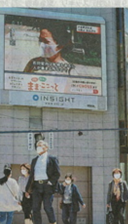
道内の休業要請延長のニュースを伝えるJR札幌駅前街頭ビジョン。経済の停滞と感染拡大への不安はさきで道民の心は揺れている。14日午後0時15分、札幌市中央区