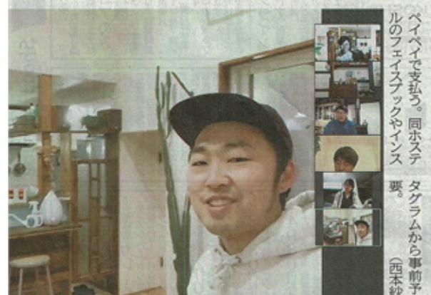
オンライン宿泊で宿の様子を紹介する蒲生オーナー=19日、