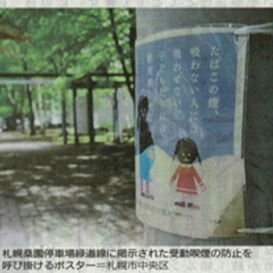
札幌駅前通緑道沿いに掲示された禁煙防止の啓発ポスター(札幌市中央区)