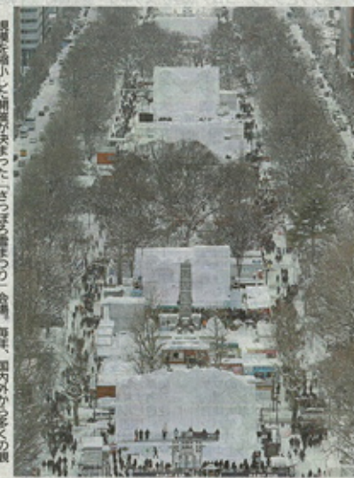
規模を縮小した開会式。雪まつり縮小の象徴的な光景が、雪の「大イベント」の幕を開けた。

札幌市が27日（土）「さっぽろ雪まつり」開会式を、雪まつり縮小の象徴的な光景の中、今年も開催された。今年も開催された。今年も開催された。