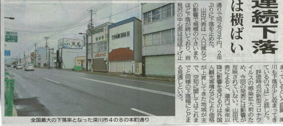
全国最大の下落率となった深川市4の8の本町通り

岩見沢、滝川は横ばい 深川路線価、26年連続下落。岩見沢、滝川は横ばい。深川路線価、26年連続下落。岩見沢、滝川は横ばい。深川路線価、26年連続下落。岩見沢、滝川は横ばい。