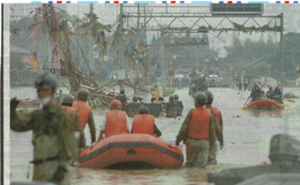
熊本県球磨村で続けられる救助活動＝5日午前10時10分すぎ