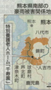
熊本県南部の豪雨被害関係地