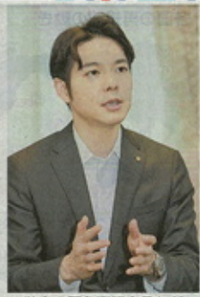
独自の緊急事態宣言などについてインタビューで振り返る鈴木直道知事