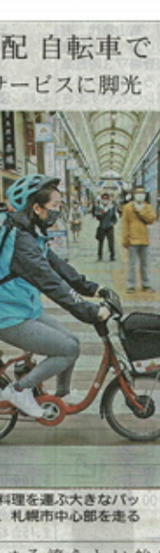
料理宅配 自転車で 札幌 新サービスに脚光

先月25日に札幌で営業開始。注文の多い札幌市。注文の多い札幌市。注文の多い札幌市。