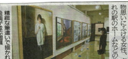
精緻な筆遣いで描かれた絵画が並ぶ個展