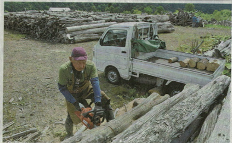
△湖流入に伴い、夏場に大量の流木が流れ着く。放るすると堤体が傷むため、管理者である同事務所が流木の除去作業を行い、同譲渡会が7月と9月の年2回、無償で一般市民に譲渡している。7月は29、30の両日も行われる。(志村直)