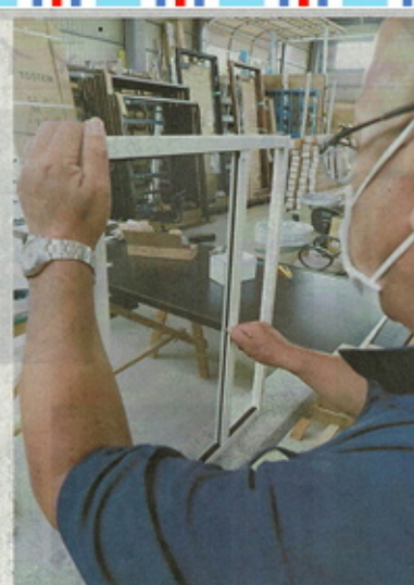
換気のための窓を開けて、室内の空気を新鮮にする。

【古石】換気のための窓を開けて、室内の空気を新鮮にする。しかし、この時期は、窓を開けると、ウイルスが侵入する可能性がある。換気の方法を工夫する必要がある。