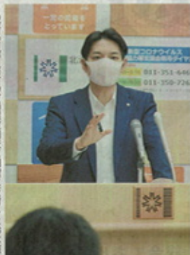
記者会見で最終処分場選定調査に明確な反対を述べた鈴木知事(左)と片岡町長(右)の発言をまとめた。