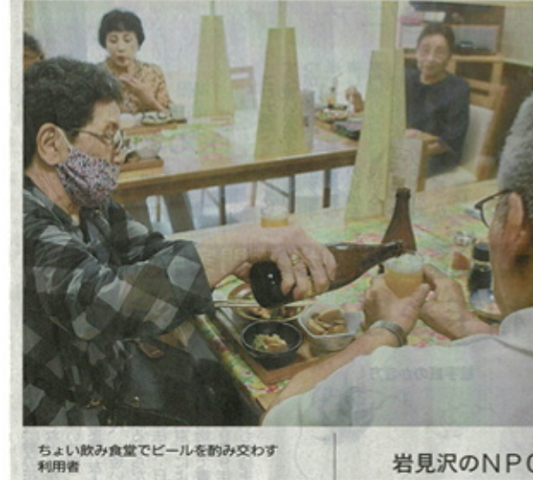
ちよい飲み食堂でビールを酌み交わす利用者

老人ホーム利用者 居酒屋を利用している。居酒屋は、交流の場としていいと思う。居酒屋は、交流の場としていいと思う。居酒屋は、交流の場としていいと思う。