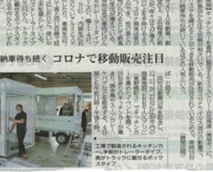
キッチンカー人気熱々