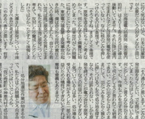
「核のごみ問題」は、環境問題の中でも最もセンセーショナルな問題の一つである。...