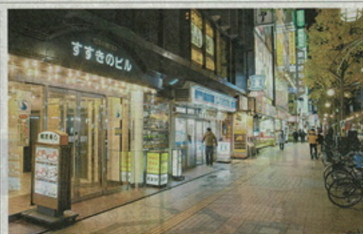
営業時間短縮などの要請が本格的に始まった札幌・ススキノ。人通りは少ない(11日午後10時25分)