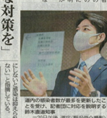
道内の感染者数が最多を更新したことを受け、記者団に対応を説明する鈴木直道知事。20日午後、道庁