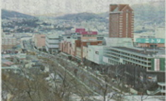
ウイングベイ小樽の歩み