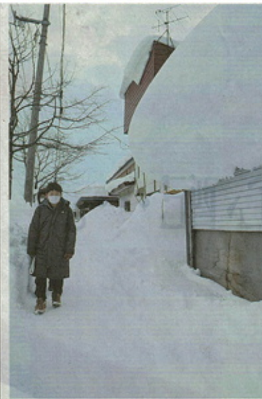
車庫の屋根から大きく張り出した雪庇がある通学路を登校する児童。24日午前7時50分ごろ、岩見沢市内

空知管内は24日、観測全10地点で日中の最高気温がプラスとなった。断続的な大雪に襲われた後、3日連続でプラス気温となった岩見沢市内では、住宅から岩見沢市が相次ぎ、自宅の屋根からの落雪に警戒され、午後5時時点で岩見沢市と札幌管内気象台による、各地の最高気温は、午