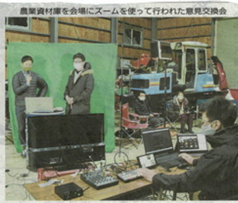
農業資材庫を会場にズームを使って行われた意見交換会

【岩見沢】新型コロナウイルスの影響で生活に困っている大学生や専門学校生に食料などを無料で提供する「クリスマス学生支援プロジェクト」が24日、道大岩見沢校近くの春日連合会館で行われた。約30人が参加し、米や野菜、カップラーメンなどをもらい、「助けてほしい」と喜んでいた。