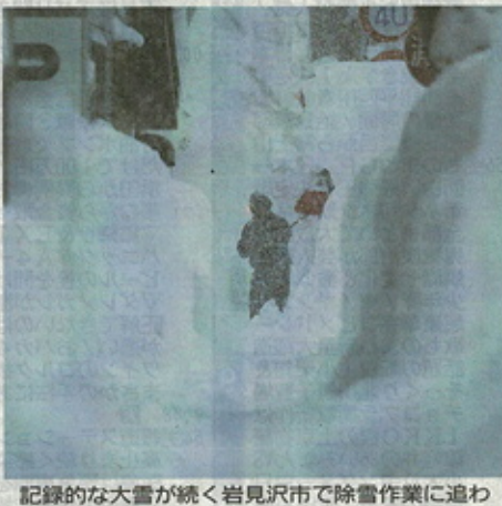
記録的な大雪が続く岩見沢市で除雪作業に追われる様子