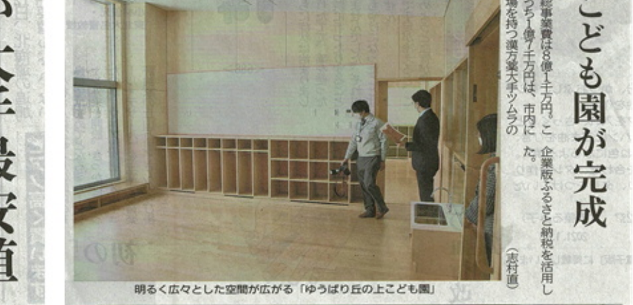
明るく広々とした空間が広がる「ゆうばり丘の上こども園」