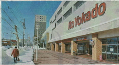
5月9日の閉店が迫るイトーヨーカドー旭川店。旭川市は所有者と連携協定を結んだ