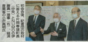
核のごみ最終処分場選定に向けた「対話の場」