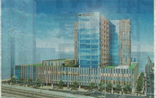
「カレス医療センター札幌病院(仮称)」の完成イメージ図