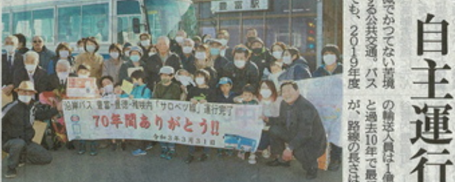
サロベツ線の最終運行を終え、JR豊富駅前で感謝の横断幕を手にする沿線住民ら=3月31日