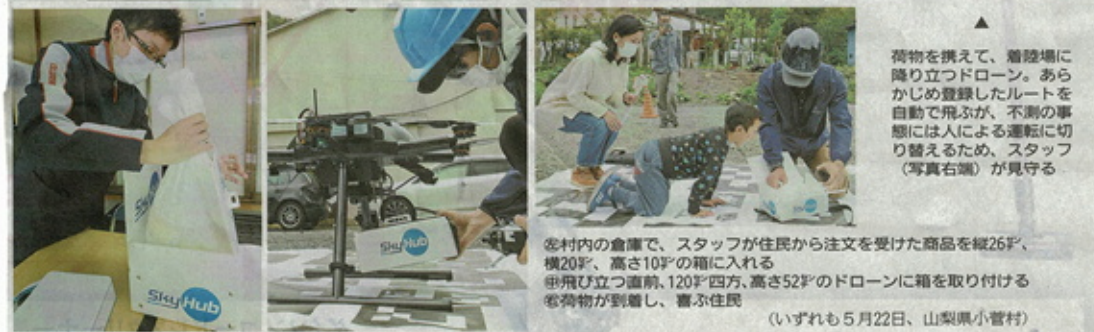
荷物を積んで、着陸場に降り立つドローン。あらかじめ登録したルートで自動で飛ぶが、不測の事態には人による運転に切り替えるため、スタッフ（写真右端）が見守る