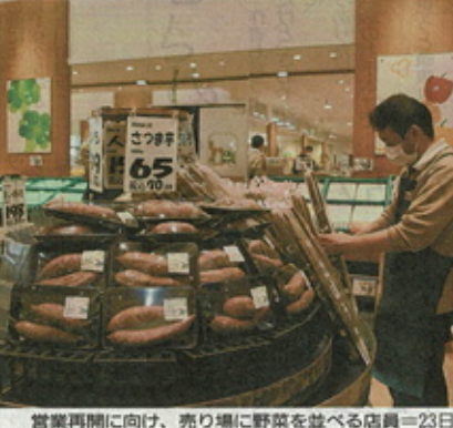
営業再開に向け、売り場に野菜を並べる店員=23日

7、8日に発生したクラスターの発生を公表し、休業していたジェイ・アール生鮮市場岩見沢店(5西9)が24日、約2週間ぶりに営業を再開する。従業員の自宅待機が22日に終わり、23日は再開準備に追われた。2012年の改装時の長期休業となったが、住民からは助ましの声も届いていたという。同店は感染対策を強化して「安心して来店してもらえるようにしたい」と話す。