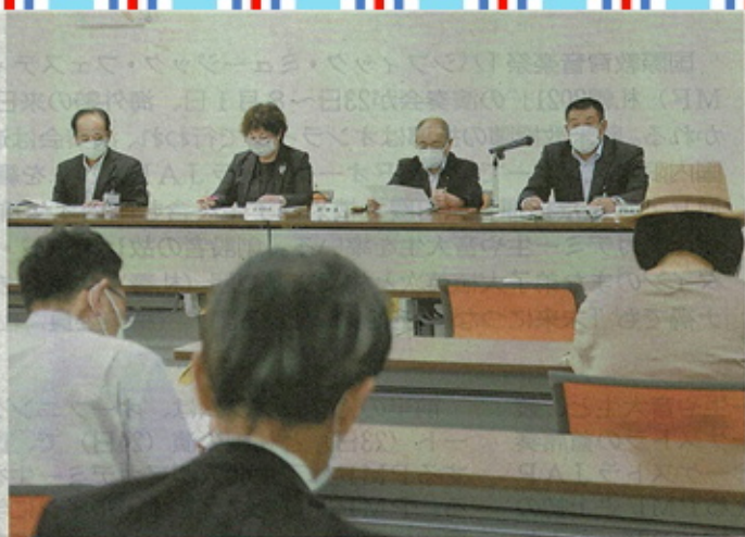
「学校選択制」の廃止方針について説明する市教委