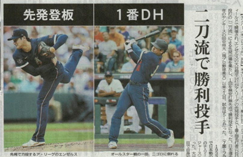
先発で力投するア・リーグのエンゼルス・大谷（13日、デンバー）

「SHO TIME」楽しめた ファンが待ちわびた「SHO TIME」だった。エンゼルスの大谷は4年目で初めて選ばれたオールスターに選出された。大谷は、先発投手として登板し、二刀流で活躍した。