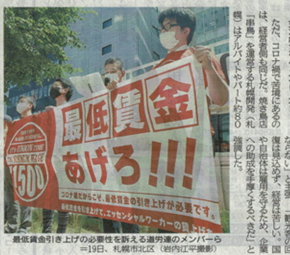
最低賃金引き上げの必要性を訴える道労連のメンバーら＝19日、札幌市北区

将来へ引き上げられない 「最低賃金が引き上げられない限り、今年も賃上げは見込めない」と、札幌市内の民間病院で非正規雇用の運転手として働く男性(60)は力なく話した。