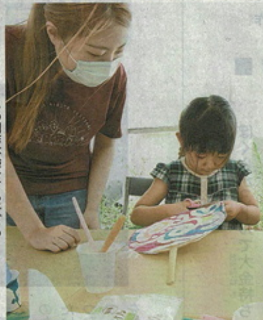
うちの制作体験をする子どもたち

岩見沢でねぶた運行をしてきた市民に聞き、実行委を立ち上げた。昨年の予定だったが、新型コロナウイルスの影響で1年延期。今年も感染対策で1日の会期に変更。学生ら約50人のメンバーで準備してきた。セミナーはPR拠点として開設した「ねぶら」(4西4)で実施。学生が10月の運行に向け、三つのねぶたを制作することや、期間中に市内の飲食店などで関連商品を販売しているなど内容を紹介した。出演した学生は「わくわくするものにして盛り上げよう」が一緒に盛り上げよう