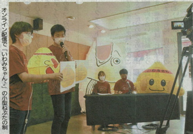
オンライン配信で「いわみちゃん」の小型ねぶたの制作などを紹介する学生たち

【岩見沢】道大岩見沢校の学生らでつくる実行委主催の初のイベント「岩見沢ねぶた祭」が21日開幕した。初日はオープニングセミナーのオンライン配信や、うちの制作体験会を行った。10月16日まで、最終日は岩見沢駅東市民広場公園でねぶたを運行する予定。(石橋治佳)