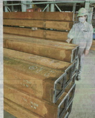
建設現場で鉄骨や鉄筋が積み上げられている様子。高騰が続く建設資材の現状を映している。