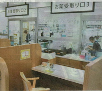
認定薬局に認定されたナカヤマ薬局の店内

患者が自分に合った「かかりつけ薬局」を選びやすくなるよう8月に導入された「認定薬局」が道内でも普及し始めている。道内では今月1日現在、道内全約300店のうち計37店が認定薬局となった。認定を受けるには医療機関との緊密な連携や専門薬剤師の配置などが必須だが、薬局側はより高い専門性をアピールできるなどのメリットがあり、大手を中心に認定取得に力を入れている。(麻植文佳)