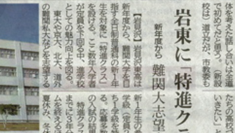
岩見沢市内3校の普通科の再編案を決定した市高校適正配置連絡会議

【岩見沢】市内の岩見沢東、岩見沢西の2校を再編し、1校にする案が、市教委から出された。市教委は、市内の普通科高校の適正配置を目的に、市教委、市内各高校の校長、教員らで構成する「市高校適正配置連絡会議」が、22日、市教委で開かれた。会議では、岩見沢市内の普通科高校2校を1校に再編する案が、承認された。 新設校は、理系も文系も受け入れる。理系は、理系科目を重点的に履修し、文系は、文系科目を重点的に履修する。また、理系科目を履修しながら、文系科目も履修する。また、文系科目を履修しながら、理系科目も履修する。また、理系科目を履修しながら、文系科目も履修する。