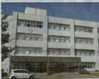
岩見沢市内3校の普通科の再編案を決定した市高校適正配置連絡会議

【岩見沢】市内の岩見沢東、岩見沢西、岩見沢緑陵の3校を再編し、2校にする案が、市教委から出された。市教委は、市内の普通科高校の適正配置を目的に、市教委、市内各高校の校長、教員らで構成する「市高校適正配置連絡会議」が、22日、市教委で開かれた。会議では、岩見沢市内の普通科高校3校を2校に再編する案が、承認された。 新設校は、理系も文系も受け入れる。理系は、理系科目を重点的に履修し、文系は、文系科目を重点的に履修する。また、理系科目を履修しながら、文系科目も履修する。また、文系科目を履修しながら、理系科目も履修する。また、理系科目を履修しながら、文系科目も履修する。