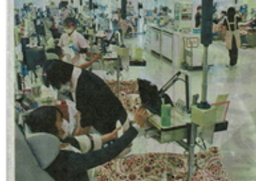
北海道赤十字血液センターで献血する人々。暴風雪などの影響で道内の献血量が減っている。札幌市西区

まん延防止影響懸念。バス運行できず20カ所中止。献血不足が深刻化している。暴風雪の影響で、献血センターへのアクセスが困難になり、献血量が減少している。