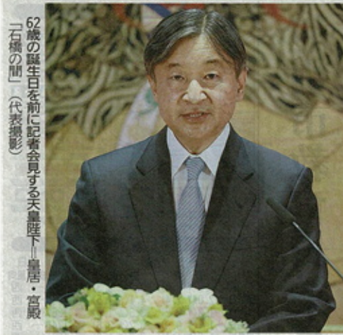
62歳の誕生日を前に記者会見する天皇陛下。皇居・宮殿「二重橋の間」

天皇陛下は23日、62歳の誕生日を迎えた。これに先立ち、皇居・宮殿で記者会見し、東京五輪や北京冬季五輪で選手が国を越えて健闘をたがえた姿に触れ、ウクライナ情勢など緊張が高まる国際社会を念頭に「お互いを認め合う平和