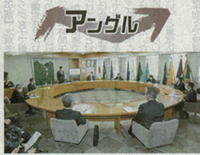
旭川市と旭川管内中部8町(旭川市、東神楽、当麻、比布、愛別、上川、東川)が1月に立ち上げた旭川大圏圏域連携中核都市圏が新年度、本格的に動き出す。連携中核都市圏は、近隣市町村が一つの圏域として経済活性化などを目標とする。圏内では札幌周辺に続く発展の期待が高まる。一方、市町村間の足並みの乱れや、事業の恩恵が旭川に集中する懸念もある。(小林中明、平岡伸志)